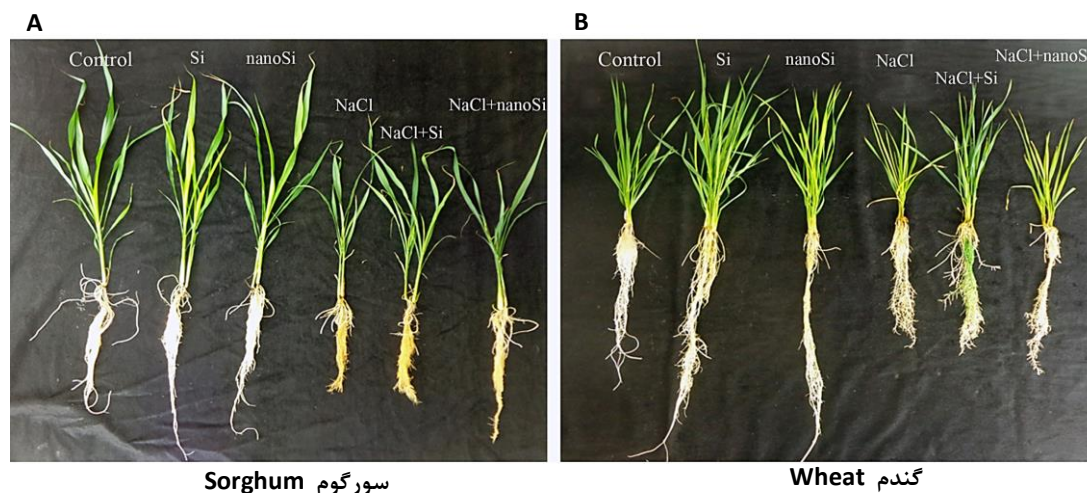
شکل ۱- اثر شوری بر الف- گیاه گندم و ب- سورگوم در حضور و فقدان سیلیکون و نانوسیلیکون.

بود (شکل ۱، جدول ۴). شوری با کاهش پتانسیل آب و ایجاد شوک اسمزی مانع جذب آب توسط ریشه گیاه می‌شود و از طرف دیگر با ورود یون‌های سدیم