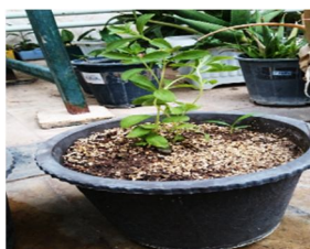
ب- گیاه استوای سازگار شده در گلخانه b

گیاهچه‌هایی که به‌وسیله فنون کشت بافت تکثیر می‌شوند، به‌منظور رشد و نمو به خاک انتقال می‌یابند. استقرار یک گیاهچه سالم در خاک و با حداقل تلفات، از نظر موفقیت تکثیر به‌وسیله کشت بافت گامی اساسی به‌شمار می‌رود.