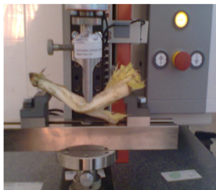
شکل ۱- تست خمش Figure 1. Bending test