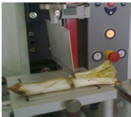
شکل ۲- تست برش Figure 2. Shear test

اندازه‌گیری خواص مکانیکی: برای تعیین ویژگی‌های مکانیکی کنگر دو تست، شکست (خمش) سه نقطه‌ای و برش مورد ارزیابی قرار گرفت. بدین منظور از دستگاه اینسترون زوییکرول (مدل Z 0.5)، استفاده گردید. برای تست خمش کنگر از پراپ سه نقطه‌ای تحت بارگذاری عمودی بر اساس استاندارد ASTM D 790-03 در دمای اتاق با سرعت تست ۲۰ میلی‌متر بر دقیقه (شکل ۱) و برای تست برش از تیغه لبه صاف به ضخامت ۱/۴ میلی‌متر و زاویه تیغه ۳۰ درجه بر اساس استاندارد 53294 DIN و با سرعت تست ۲۰ میلی‌متر بر دقیقه اندازه‌گیری گردید (شکل ۲). دستگاه اینسترون همزمان به رایانه متصل بوده و داده برداری صورت می‌گرفت. هر یک از آزمون‌ها در ۳ تکرار انجام گرفت.