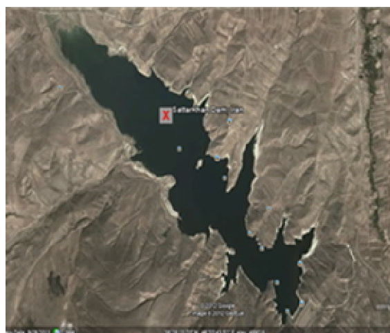
شکل ۲- دریاچه مخزن سد ستارخان.