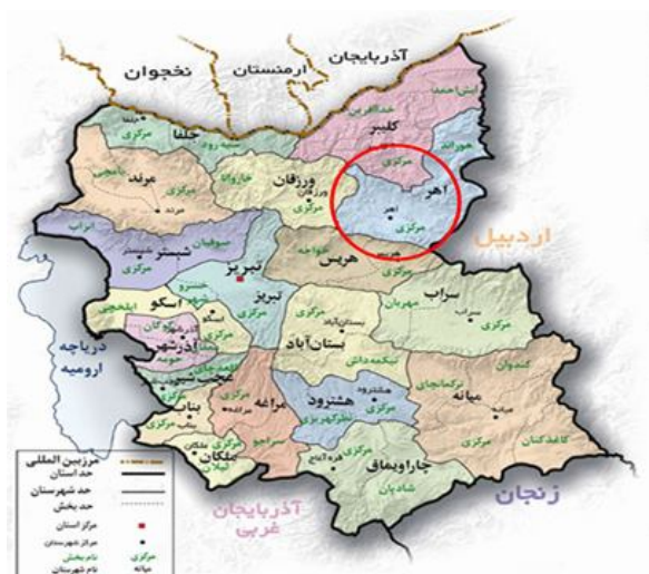
شکل ۱- موقعیت سد ستارخان در استان آذربایجان شرقی - اهر.

در سال ۱۳۷۷ به بهره‌برداری رسیده است و عملیات رسوب‌سنجی آن برای اولین بار در سال ۱۳۸۸ صورت گرفته است (گزارش آب منطقه‌ای، ۲۰۰۹).